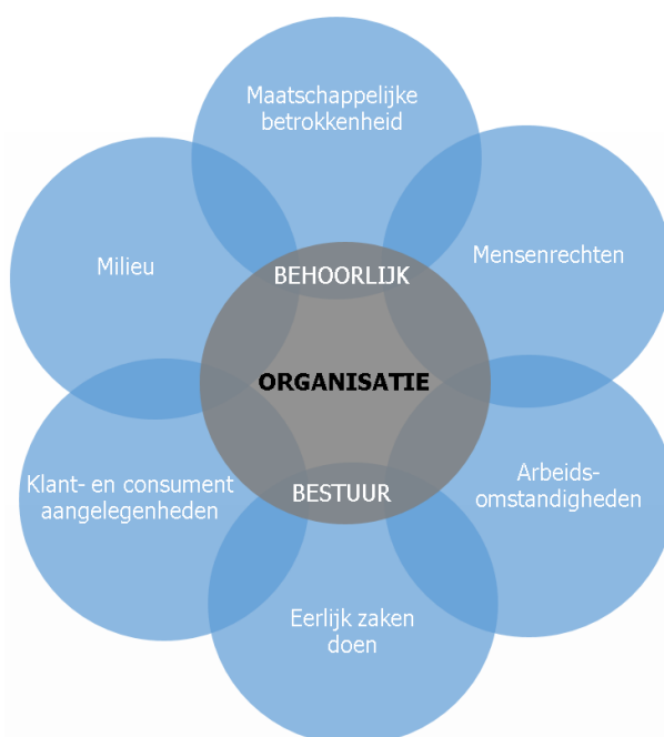
Figuur 2: 7 kernthema's van maatschappelijk verantwoord ondernemen

Niet alle onderwerpen zijn relevant voor iedere organisatie. Daarom is de eerste stap het bepalen van onderwerpen die voor Aarts Conserven van toepassing zijn. Een onderwerp is relevant als het speelt bij de activiteiten en besluiten, waardoor die effect (kunnen) hebben op stakeholders en/of op duurzame ontwikkeling. Hierbij kijkt Aarts Conserven naar de eigen activiteiten en besluiten en naar die van organisaties binnen haar waardeketen en invloedssfeer.