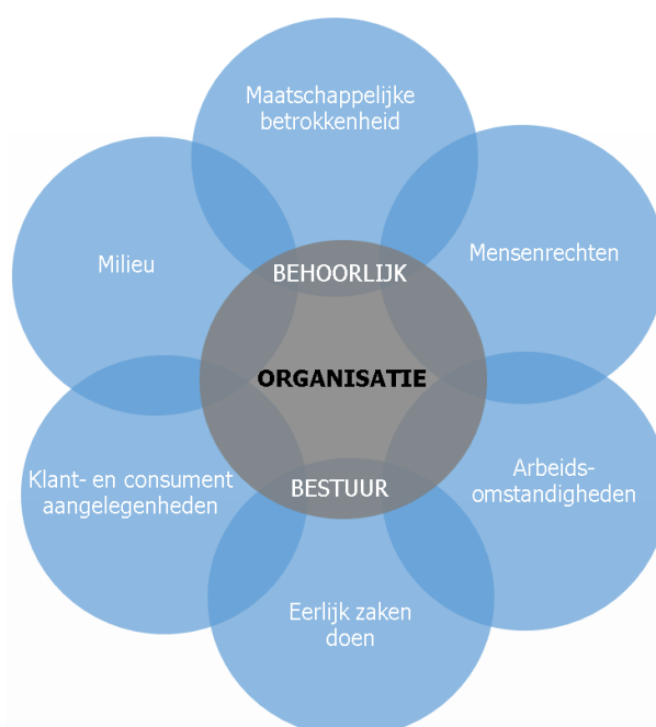
Figuur 2: 7 kernthema's van maatschappelijk verantwoord ondernemen

Niet alle onderwerpen zijn relevant voor iedere organisatie. Daarom is de eerste stap het bepalen van onderwerpen die voor Aarts Conserven van toepassing zijn. Een onderwerp is relevant als het speelt bij de activiteiten en besluiten, waardoor die effect (kunnen) hebben op stakeholders en/of op duurzame ontwikkeling. Hierbij kijkt Aarts Conserven naar de eigen activiteiten en besluiten en naar die van organisaties binnen haar waardeketen en invloedssfeer.